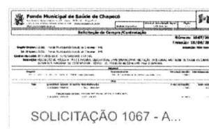
SOLICITAÇÃO 1067 - A...