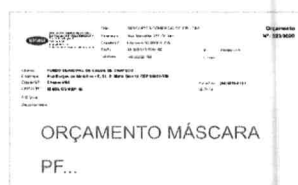
ORÇAMENTO MÁSCARA PF...