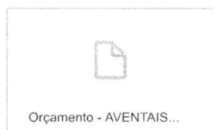
Orçamento - AVENTAIS...