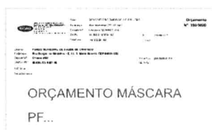
ORÇAMENTO MÁSCARA PF...